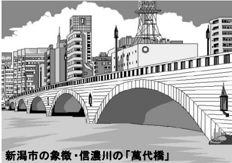
新潟市の象徴・信濃川の「萬代橋」