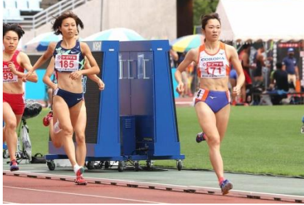
<中間点力走; 左手前・ト部 / 右・広田>

秋田大医学部を卒業。国家試験にも合格しているが、研修医にはならず、出身地の新潟で競技を続けてきた。医学生時代は、競技と勉学を両立した。今後は秋の三重国体に向け、さらなる記録更新に挑む。「予選の感覚から、走ってみて自分にはまるペースなら、もっとタイムが出ると思う。(周囲に)喜んでもらえる結果を今シーズンいっぱい出していきたい」と前を向いていた。