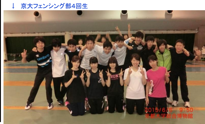
2015/6/6 9:50 京都大学総合博物館