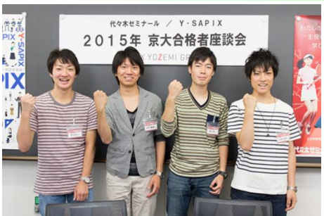
↑ 2015/3、代ゼミから京大合格...右から2人目