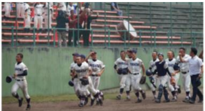
2018年夏4回戦で優勝候補の日本文理を破ったものの、準々決勝で新発田高校に敗れベスト8。甲子園に届かず。