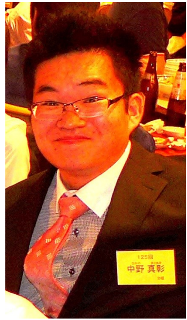
そこで何か自分の“好き”を深化させたいと思います。

後期はネットワークインフラやコンピュータセキュリティ関連のバイトやインターンをやりたいと考えています。