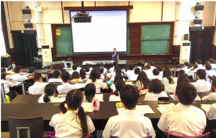
<写真1 ; 東大での特別講義の様子 ~ 2014.7.31>