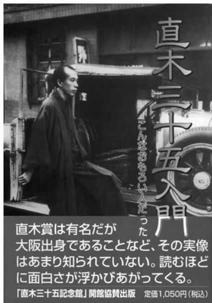
直木賞は有名だが大阪出身であることなど、その実像はあまり知られていない。読むほどに面白さが浮かびあがってくる。 「直木三十五記念館」開館協賛出版 定価1,050円(税込)

これは文藝春秋社版『直木三十五伝』からはみ出したものであるが、あまり知られていない幼年時代のエピソードなどとりあげ、自分では、なかなか価値ある読物だと思っている。